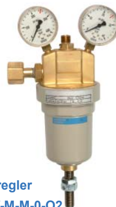
Hauptstellendruckregler U13 M-200-20-M24f-M-M-0-O2