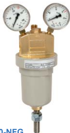
Leitungsdruckregler U13 P-200-16-0-M-M-0-NFG